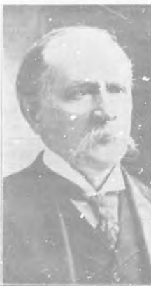
Dr. Ramón Barros Luco

Sabido es que por defunción del Presidente y del sustituto en breve espacio de tiempo, quedó vacante el elevado cargo.