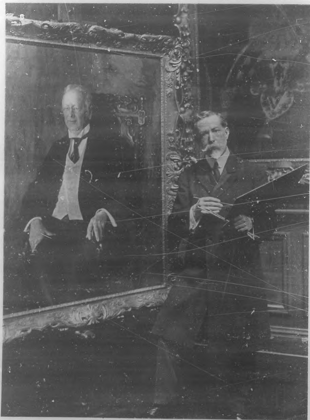
Laureado pintor español, retratando a un millonario americano, durante la excursión que acaba de realizar por los Estados Unidos.

ES nuestro huésped el insigne pintor español Luis Graner. Su estancia será breve, pero no tanto que no nos permita deleitarnos con la contemplación de algunos lienzos debidos a la inspiración del artista, quien en los blancos salones del Ateneo exhibirá unos cuantos de aquellos en no despreciable número.