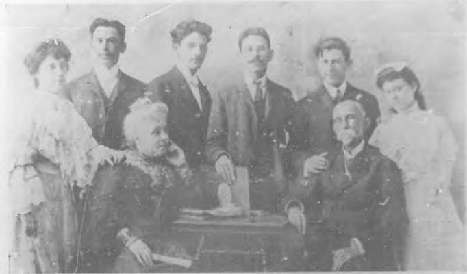
La familia del General Máximo Gómez