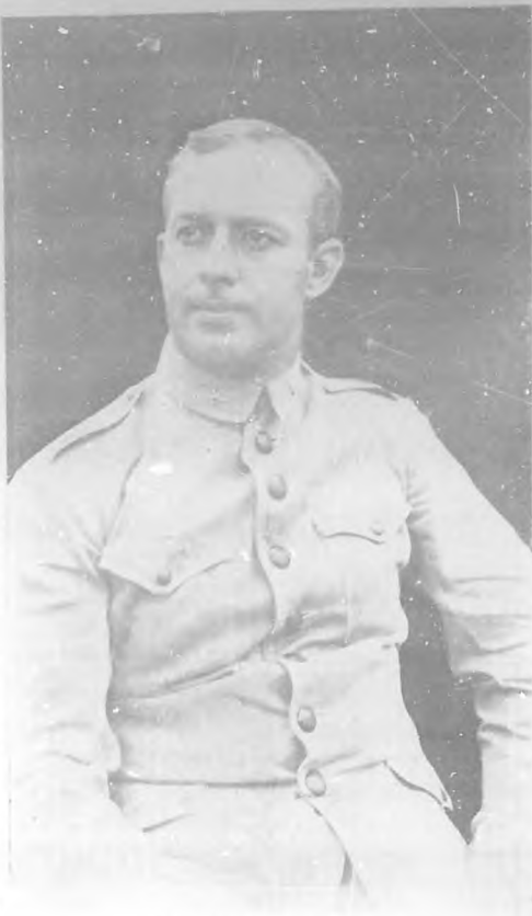
Brigadier Armando J. de la Riva

repetir que su cultura, sus conocimientos y su amor á Cuba y á la verdad histórica, son la mejor garantía del éxito de la misión á ellos encomendada.