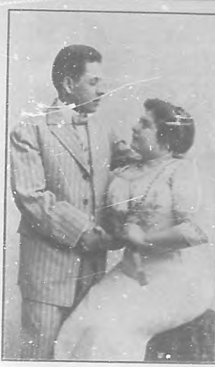
El grupo que crea esta plana, es hoy una realidad habanera.

Después de la orquesta de damas víamos que tanto calor obraba en el Valedo del Polvoroso, Habana, no habíamos visto á ver una dama al frente de un grupo de profesores.